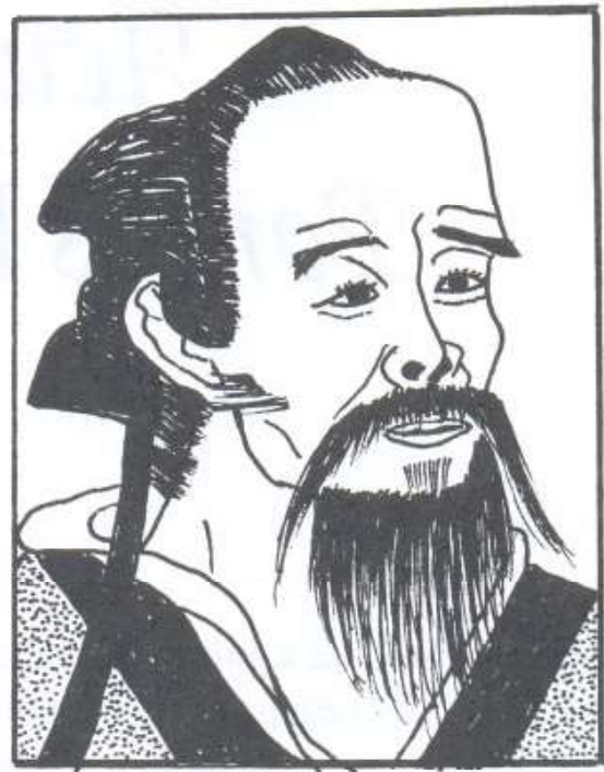
FIGURA 11.2 – Huatuo (119-207).

Considerado o Médico Divino do século II 32 , por ser excelente em Acupuntura e utilizar com sucesso poucos acupontos, foi discípulo do famoso médico Hsu-chou. Para nossa época, em que procuramos concentrar a atenção em uma única especialidade, parece impossível um homem acumular tantos conhecimentos ao mesmo tempo.